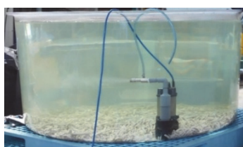
写真-1 水槽中の人工海水とナノバブル装置

残餌由来のアンモニア処理に寄与する細菌叢の調査を 2000L 水槽を用いて実施した。実際にトラフグを飼育する水槽でアンモニア処理を行っていた細菌を、セラミック製多孔質担体に定着させ、水槽にその担体を 12.5kg、パージンの担体を 37.5kg 敷き詰めた。人工海水 2000L を入れ、ナノバブル装置（エア吐出力：10~15L/min）を運転した（写真-1）。水槽に餌を投入した直後にアンモニア態窒素濃度は上昇するが、数日後には減少した（図-1）。実験開始から 2 週後、6 週後および 10 週後に採水した。採水した試料から細菌を捕集し、DNA を抽出した。次世代シーケンサーを用いて塩基配列解析を行い、得られた配列を既知の 16S rRNA 遺伝子のデータベースと比較することで菌種の推定を行った。2 週後、6 週後および 10 週後の各試料において、存在割合が 1% 以上であった属レベル（一部は科、門レベル）の細菌とその存在割合を図-2 に示す。