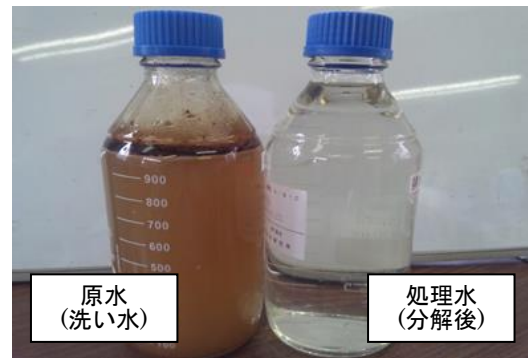
C重油タンクのスラッジ洗浄水