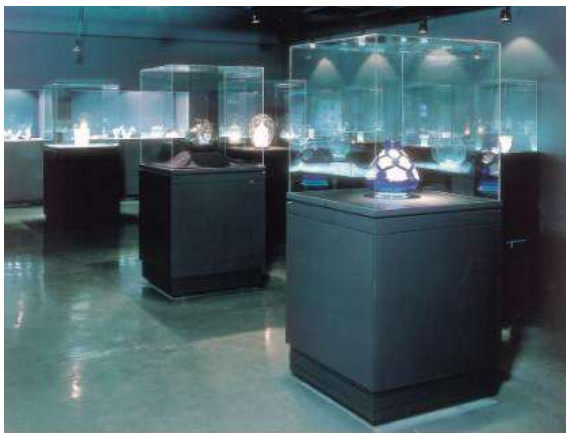
免震展示ケースの例