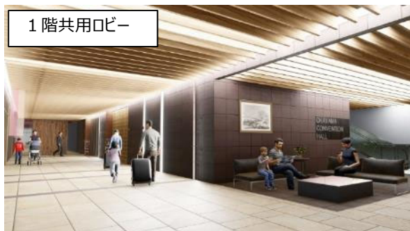
ホテルと合わせて、コンベンションホールを設置し、周辺コンベンション施設との連携により、岡山市が推進するMICE(国際会議・ビジネスイベント等)の誘致を促進