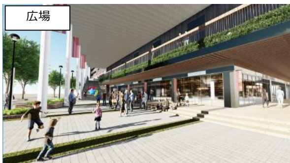
大屋根を備えた広場は、地域イベントで岡山の魅力を発信するだけでなく、非常時には避難場所としても機能