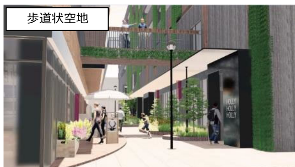
歩道状空地の確保により、歩行者空間にゆとりを生み出し回遊性を向上