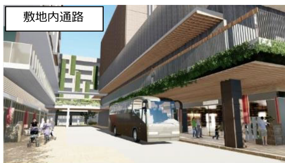
観光バスベイの設置、デジタルサイネージによる観光情報の発信により、観光客の利便性を向上