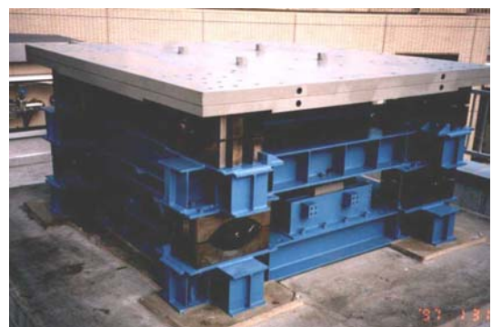
パッシブ制振システム／TRD