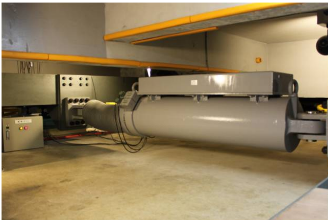
減衰可変ダンパー