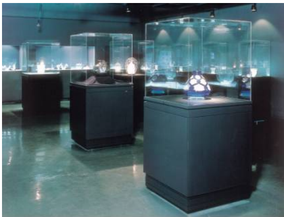
免震展示ケースの例