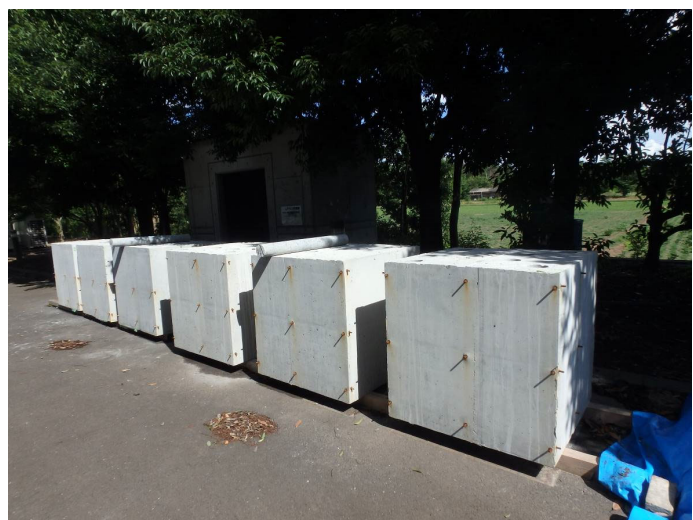
[ CELBIC の建設材料技術性能証明書 ]