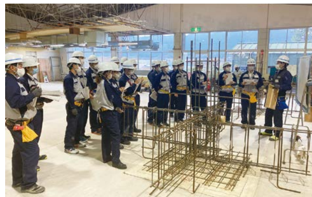
富士教育訓練センターでの入社時研修