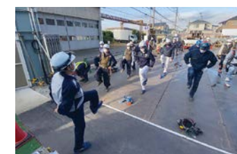
けんせつ体操の実施状況