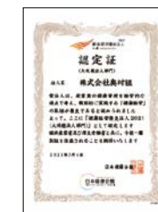
健康経営優良法人2021認定証

これらの健康増進の取り組みにより、今年度は、「健康経営優良法人2021(大規模法人部門)」に認定されるとともに、従業員健康増進のためにスポーツ活動の促進に積極的に取り組む企業として「スポーツエールカンパニー2021」にも認定されました。