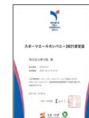
スポーツエールカンパニー2021認定証